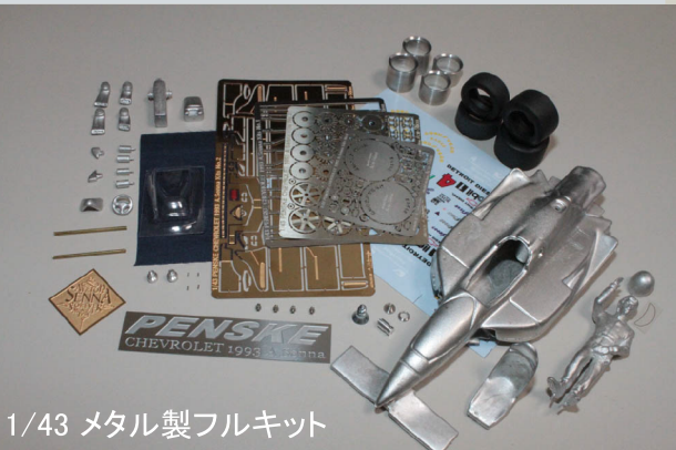
1/43 メタル製フルキット