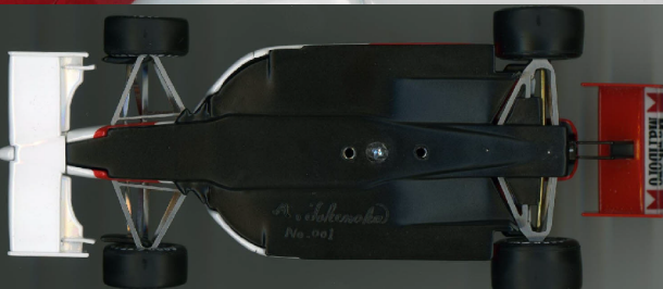
空力シャーシーには、シリアルNo.001が刻印